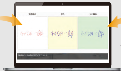
2つの署名がイメージで抽出され照合される